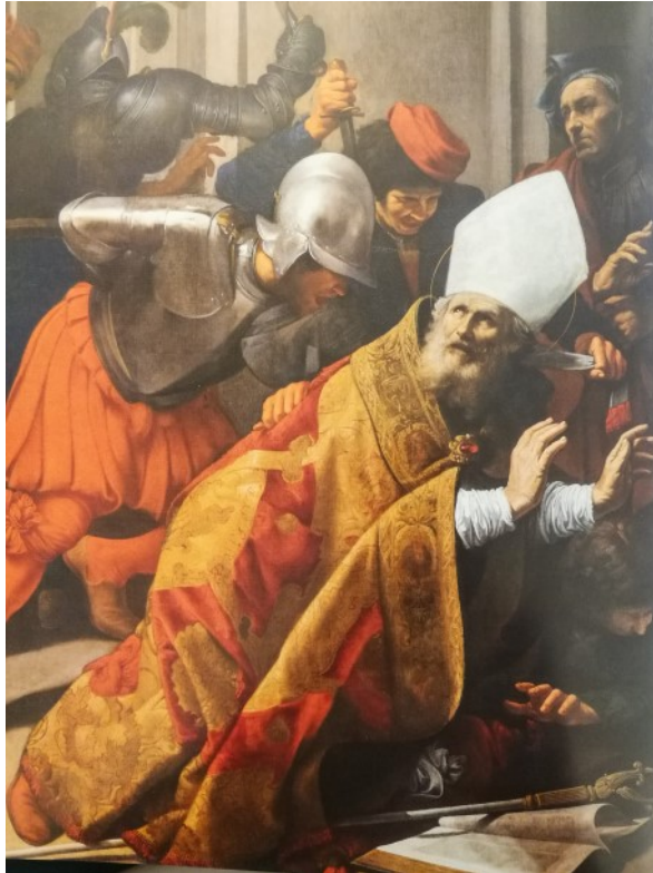
(Martyrium des Heiligen Lambert, Santa Maria dell'Anima)

GEMEINDEBRIEF NR. 97 AUGUST - SEPTEMBER 2019