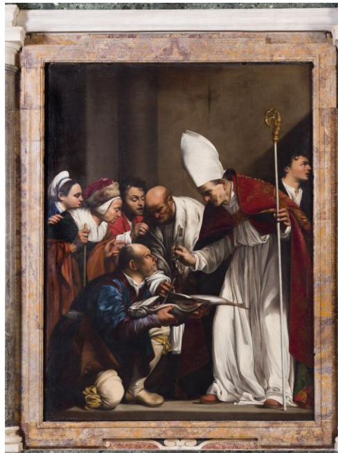
(Kapelle des Hl. Benno – Kirche Santa Maria dell'Anima)

Wenn wir geliebt und angenommen sind, wenn wir Vergebung und Versöhnung schenken dürfen, wenn wir Schaffenskraft und geglückte Arbeit erleben, wenn sich Probleme unerwartet lösen: lasst uns einstimmen in euer Lob! (aus der Andacht „Heilige“ Gotteslob 676,6)