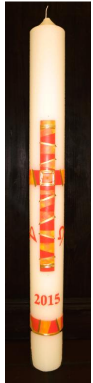
Unsere diesjährige Osterkerze!

Montag bis Freitag 09:00 bis 12:45 Uhr 15:30 bis 18:00 Uhr 18:30 bis 19:00 Uhr 21:00 bis 23:00 Uhr Samstag 15:30 bis 18:00 Uhr Sonntag 09:00 bis 10:00 Uhr 16:00 bis 23:00 Uhr